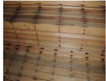
[그림 13] 사우나 의자의 못이 박힌 부분에서 보이는 탄화흔적들이 관찰된다.

남탕에 설치된 스테인리스 숯통은 벽면 목재 마감재에 밀착되어 위치하고 있으며, 히터 방향에서 부분적인 수열변색흔적이 관찰되었고, 사우나실 목재의 못이 박힌 부분에서 대부분 깊은 탄화흔적을 발견할 수 있었다.