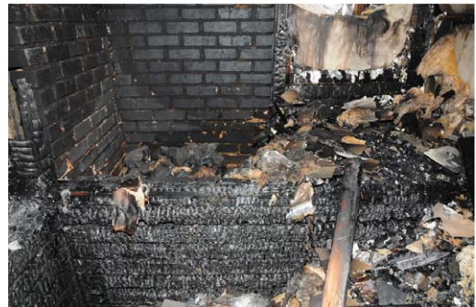
[그림 8] 사우나실 내부 - (좌) 히터, (우) 소화기가 있던 장소