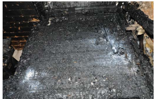
[그림 10] 소화기가 위치한 장소에서 소화기 분말이 발견됨.