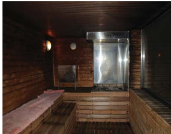
[그림 11] 남탕 사우나의 모습 : 숯이 담긴 스테인리스 용기에서 부분적인 수열변색 흔적이 관찰된다.

소화분말의 위치를 통해 초기진압장소 즉 발화부일 가능성이 높다는 것은 알 수 있었지만 점화원과 관련 하여서는 특이할 만한 흔적을 발견할 수 없었다. 이곳에서 저온발화에 의해 화재가 발생하였다는 것은 남탕 사우나를 확인하면서 알 수 있었다.