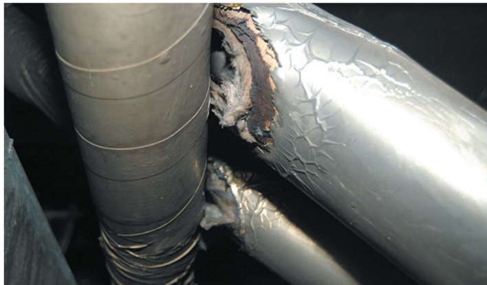
[그림 6] 온수배관이 교차 접촉되는 2개소의 단열재가 각 부분적으로 탄화되어 있다.

대형병원의 지하에 위치한 보일러실 상단부에서 화재가 발생하였던 사례로 상단부에는 고압스팀보일러의 온수배관이 설치되어 있으며, 일반적으로 발화원으로 작용하였다고 볼만한 시설 및 기구, 조건이 없는 상태에서 화재가 발생하였다. 실제 현장은 온수배관의 단열재 등이 연소하면서 대부분이 연소된 상태로 현장 조사에 어려움을 겪을 수밖에 없었다. 현장에서는 남아있는 연소형태나 특이점들을 발견할 수 없었지만 보일러실 입구에서 다음 사진과 같은 온수배관의 탄화흔적을 발견할 수 있었다.