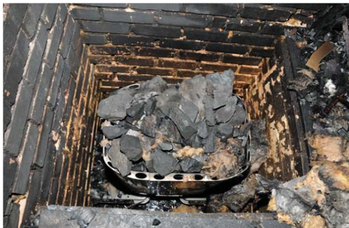
[그림 9] 사우나실의 열원인 시즈히터 위에 돌이 올려져 있는 상태임.