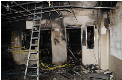
[그림 7] 사우나실의 입구 - (좌) 습식사우나, (우) 건식 사우나 화재는 건식사우나에서 시작되었음.

사우나는 12년 전부터 운영되고 있었는데 건식 사우나 내에는 매일 06:00부터 22:00까지 약 80℃의 온도로 운영하고 있는 상태였다. 현장을 조사했을 때 본건 화재가 발생하였던 여자 건식 사우나실은 내부가 대부분 연소된 상태로 현장을 조사하기가 매우 어려운 상태였다. 다만 현장에서 발굴할 때 발견된 소화기 가루의 위치를 통해 초기 소화활동이 이루어졌던 장소를 알 수 있었다. 이 장소는 사우나실의 잠냄새를 없애기 위해 스테인리스 재질의 상자에 숯을 담아 보관하고 있었던 장소이다.