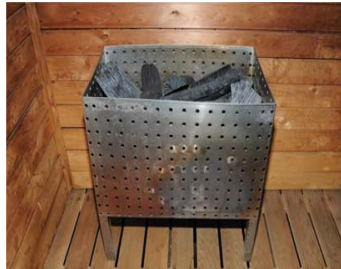
[그림 12] 히터방향으로 수열변색흔적이 관찰된다.