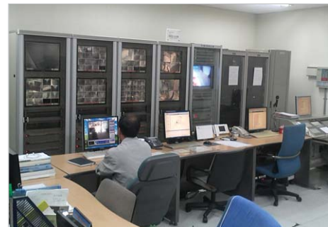
▲ 방재실 내부