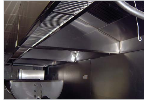
▲ 안전하고 청결하게 관리되고 있는 주방후드

창조의 시대, 상상력의 시대라 불리는 요즘, 새로운 가치를 먼저 찾아내어 새로운 시장을 창출하는 기업만이 지속적인 성장이 가능할 것이다. 창조경영을 경영이념으로 보다 앞선 미래를 위한 창조혁명을 강조하고 있는 한진중공업이 세계시민으로부터 사랑받는 글로벌 기업으로 앞으로도 지속적인 성장을 이루길 바라며 탐방을 마쳤다. ☺