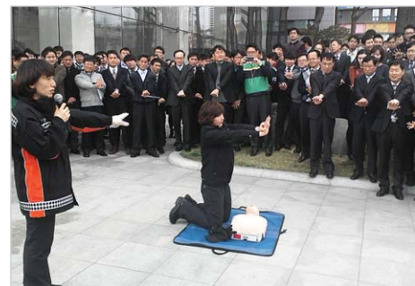
▲ 한진중공업 전 직원 화재예방교육