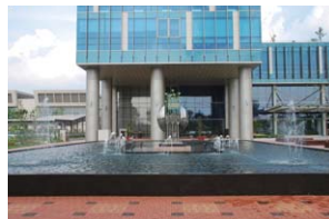
▲ 하늘 거울 분수

정부광주합동 청사는 건물 안팎에 생물 서식공간과 공원을 마련하고, 어린이 자연체험