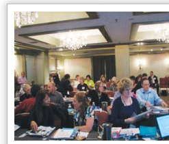
[사진 2] Remembering When 컨퍼런스