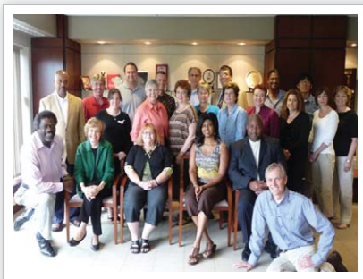
[사진 3] 안전교육메시지 위원회