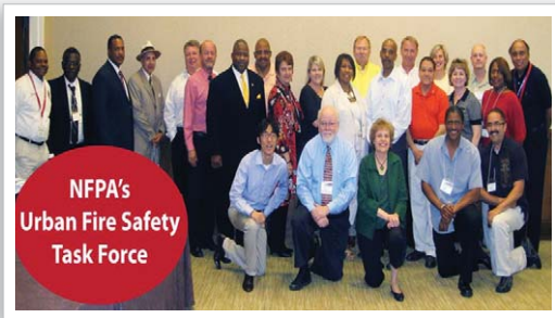
[사진 1] 대도시 화재안전 TF

NFPA가 제작하는 다양한 맞춤형 교육자료들을 사용하는 기관들은 매우 다양하다. 소방서, 공무원, 안전기관, 안전강사 등 다양한 사람들이 NFPA의 교재 및 프로그램을 사용하고 있다. 이들은 단순히 NFPA 교재를 사용하는 것뿐만 아니라, 교재의 기획, 제작 단계부터 NFPA와 긴밀하게 협력하고 있다. NFPA는 이러한 협력을 위해 안전교육메시지 위원회, 대도시 화재안전 TF, Remembering When 컨퍼런스 등 다양한 위원회 및 컨퍼런스를 개최하고 있다. 긴밀한 협력체계를 통해 다양한 교육주체와 역량을 합침으로써 교육효과를 극대화할 수 있는 능력을 갖게 되는 것이다. ☞