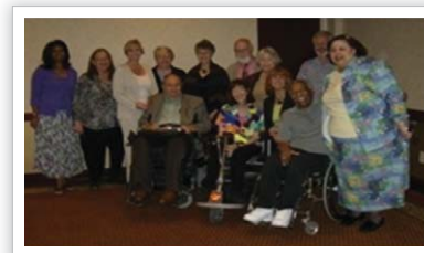
[사진 4] 장애인 화재안전 TF