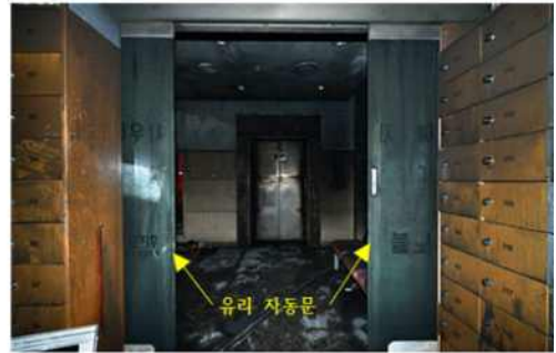
① 2층 주계단 앞 버튼식 유리자동문