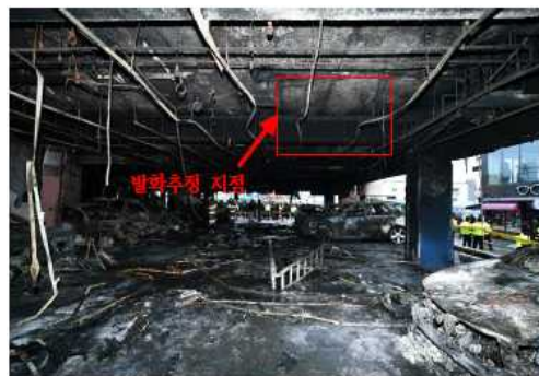
그림 5. 1층 주차장 연소상황(우측면)