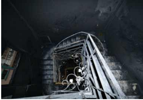
그림 7. 건물 중앙 주계단 연소상황