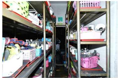
② 비상계단 앞 목욕용품 적재(비상구 막힌 상태)