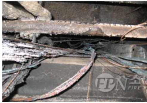
그림 8. 케이블 방화구획 관통부 구획불량