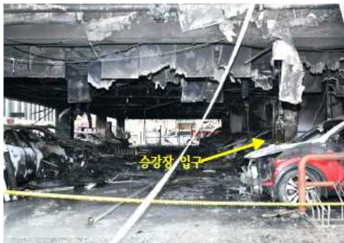
그림 4. 1층 주차장 연소상황(좌측면)

한 시사 교양 프로그램 2) 에서 방송한 자료에 따르면 화재 신고 20여분 전에 1층 천장에서 1차 화재가 발생한 사실이 밝혀졌다. 현장 관계자가 걸으로 보이는 불길은 잡은 것으로 추정되나 천장 내부의 가연성 단열재에서 화재가 지속적으로 성장하여 화재가 확대된 것으로 보인다. 소방당국 3) 에 따르면 천장에 배관 열선 설치 작업을 하던 도중 튼 불꽃이 스티로폼에 옮겨 붙었다. 이로 인해 불붙은 스티로폼이 아래 주차장에 있던 차량으로 떨어지면서 옮겨 붙어 불길의 번진 것으로 추정된다.