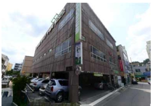
그림 2. 화재발생 전 건물상황