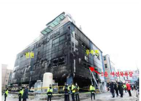
그림 3. 화재발생 후 건물상황