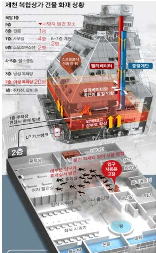
그림 1. 제천 스포츠센터 화재 개략도