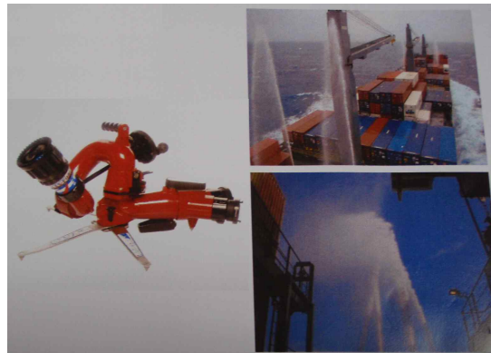
Mobile water monitor

이에 독일은 FP 54('10.4)에서 갑판 상부 컨테이너 화재에 대한 공식안전평가(Formal safety assessment) 보고서를 제출하여 이러한 화재 위험에 대한 장치로는 이동식물방사기(Mobile water monitor)와 미분무창(Water mist lance)이 비용 대비 효과적이라고 주장하였다.